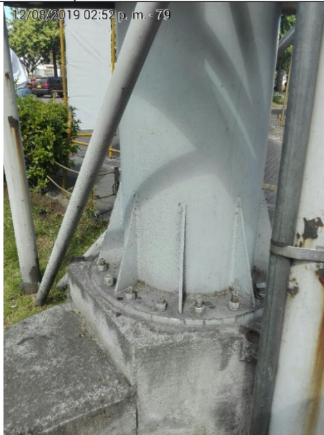
Foto No.3: Detalle de la cimentación y base-platina y pernos de la estructura de la valla, ubicada en la Av. Calle 80 No. 74 A-21 INT 10 LC 15 (dirección catastral), orientación Oriente-Occidente.