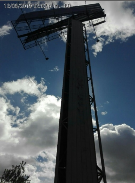
Foto No.1 y 2: Vista del predio, de la estructura y mástil de la valla tubular, que se encuentra en buenas condiciones y estable, instalada en la Av. Calle 80 No. 74 A-21 INT 10 LC 15 (dirección catastral), orientación Oriente-Occidente.